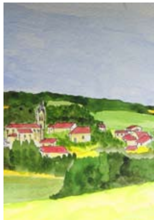
Montignac de Lauzun

Sur ce circuit, découvrez comment les constructions révèlent le paysage environnant.